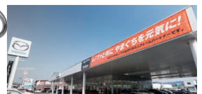
山口マツダ山口店(本社 維新公園前)

リーグ後半戦を対象とした第2弾の抽選ナンバー券は、7月29日(土)の山口マツダ冠マッチ(横浜FC戦)で配布予定です。