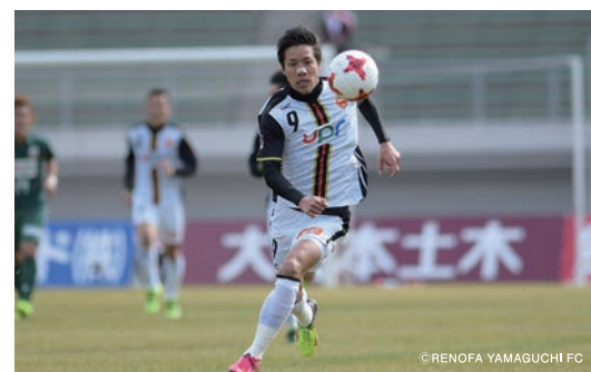
不振の昨季からの復活を目指す新シーズン。開幕の岐阜戦でいきなりの2ゴール。