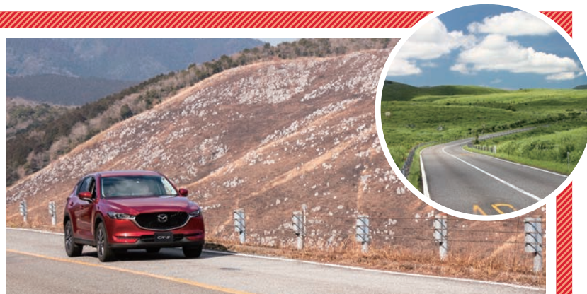
撮影は山焼き直後の3月3日。春先に新緑が芽吹き、夏には緑の絨毯のような草原が広がる(右上写真)。

秋吉台は美祿市中・東部に広がる日本最大級のカルスト台地。広大な草原地に無数の石灰岩柱が露出し、地下には秋芳洞など400以上の鍾乳洞があります。そのカルスト台地の中を走り抜ける道路が、秋吉台公園線・県道242号線。総距離約13kmの観光道路で、通称「カルストロード」と呼ばれています。秋吉台の雄大な景色を眺めながら、草原の中をドライブすることができ、適度なワインディングロードは自動車のみならず、バイクのツーリングコースとしても人気のスポット。2月の山焼き、緑が広がる春~夏、黄色く染まる秋、雪景色の冬と、四季折々に異なった表情が楽しめるドライブコースです。