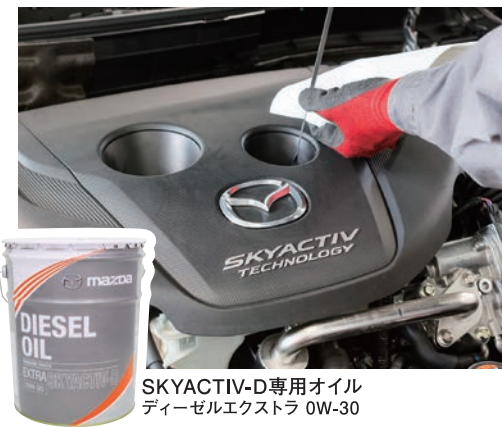
SKYACTIV-D専用オイル ディーゼルエクストラ 0W-30