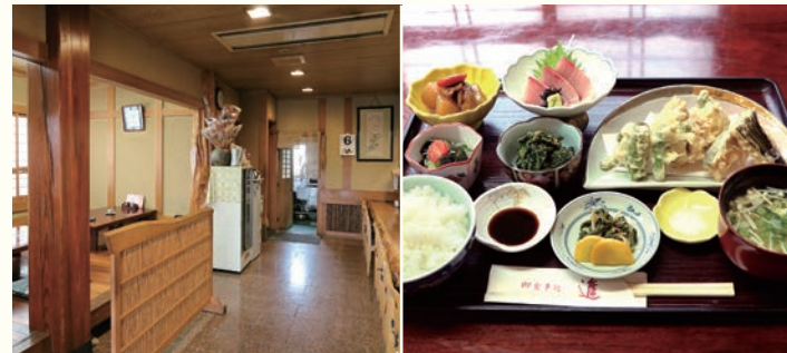
【写真左】落ち着いた雰囲気店内 【写真右】一番人気の日替り定食1000円(土日祝・正月・盆は除く)

[ハガキ]〒753-0815 山口市維新公園3-8-5 山口マツダ(株) 新車営業部 「山口マツダマガジン ヤマグチ逸品」係 [Eメール]info@yamaguchi-mazda.co.jp 件名「山口マツダマガジン ヤマグチ逸品」にてお送りください。